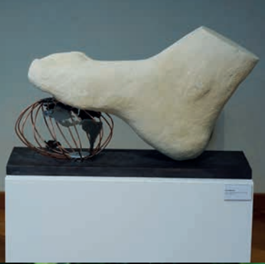
HEINZ BREHM Windisch, CH Fussabdruck, 2024 Savonnière-Kalkstein, Stahl, Holz