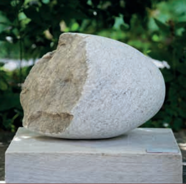
KLAUS EICHLER Uster, CH Rotto, 2024 Peccia-Marmor