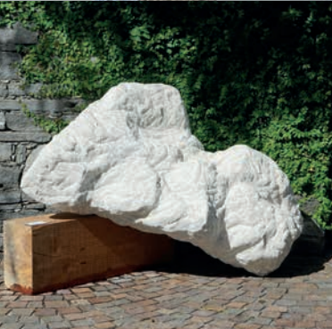
JÜRGEN MÖLLER Bochum, DE Il ferimento, 2024 Peccia-Marmor