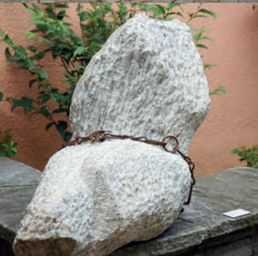
KURT MÜLLER Näfels, CH Der grosse Zerstörer, 2024 Peccia-Marmor, Stahl

Die Werke setzen sich mit der fragilen Beziehung zwischen Mensch und Umwelt auseinander – mit Eingriffen, Brüchen und Spuren der Veränderung. Stein wird dabei zum Dialogpartner: kraftvoll, widerständig, poetisch.