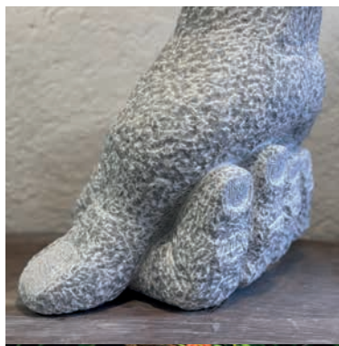
YVES PORTENIER Gilly, CH Sous Pression, 2024 Cas de Conscience, 2024 Peccia-Marmor