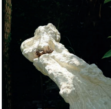
HANS-PETER PROFUNSER Berg im Drautal, AT Der Zerbrochene, 2024 Rumänischer Kalkstein Weitere Werke vor Ort.